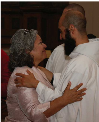
Padre Basilio abbraccia sua madre dopo la sua ordinazione.